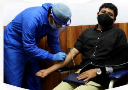
PRUEBA RÁPIDA COVID-19 • Cualitativa • Cuantitativa