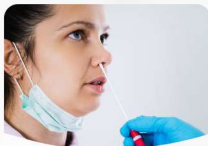
PRUEBA DE ANTÍGENO COVID-19